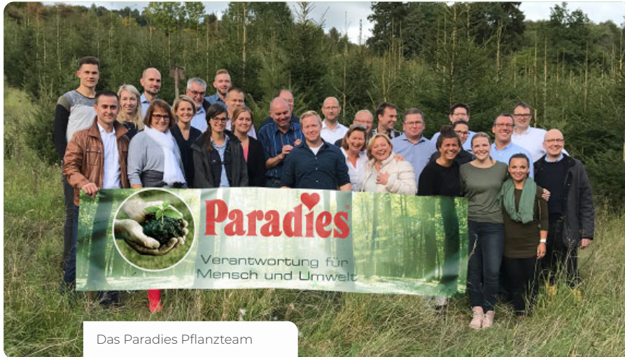
Das Paradies Pflanzteam

Engagement für die Umwelt und die Kleinsten. Wir müssen uns um diejenigen kümmern, die nicht selbst für sich sorgen können.